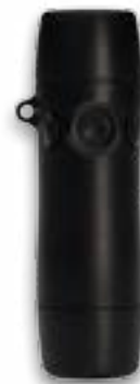
PROVOX® TruTone EMOTE

De Provox TruTone EMOTE is na een totale laryngectomie te gebruiken als permanent communicatie hulpmiddel.